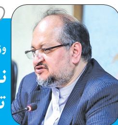
وزیر کار تاکید کرد