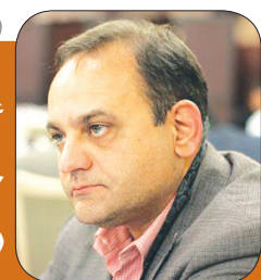
عضو هیات مدیره خانه صنعت و معدن:

خودروسازان باید زمینه‌ساز رشد قطعه‌سازان شوند