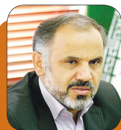
مدیر اکتشاف شرکت ملی نفت خبر داد