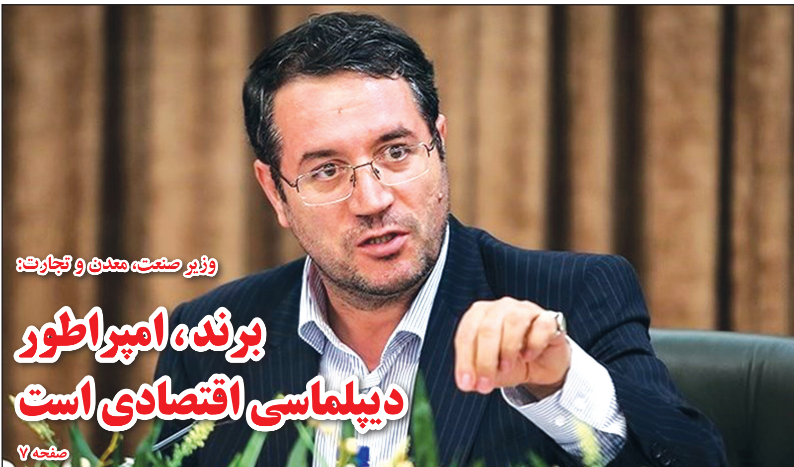
وزیر صنعت، معدن و تجارت: